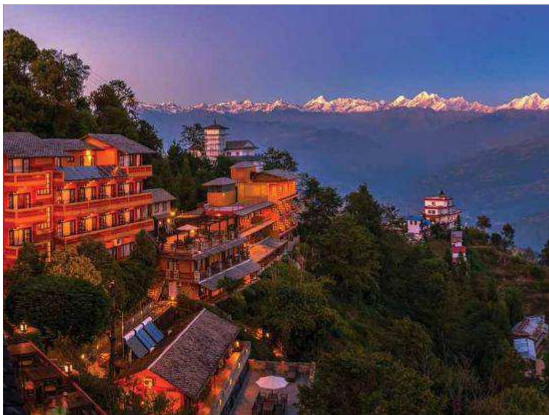
Hotel Country Villa , Nagarkot , Nepal

Non-stop 12 intensieve en actieve onderwijs-dagen die ons heel erg van nut zullen zijn in onze bediening in Sanggau , alsook in onze relaties met iedere medemens. Ik kijk er al naar uit om in het dagelijkse leven de dingen toe te passen die we hier geleerd hebben.