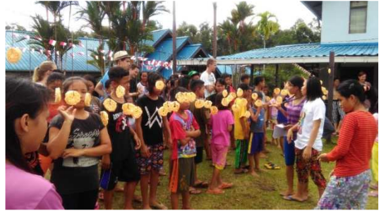
wedstrijdje kroepoek happen