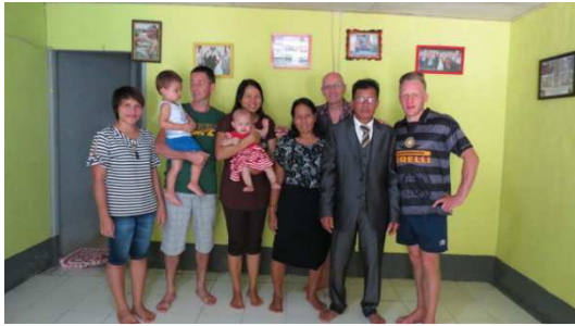
familiebezoekje bij Uci's ouders

Het was een emotioneel weerzien voor zowel haar alsook voor vele kinderen en staff die haar toen nog gekend hebben. Voldaan en enthousiast nam ze een weekje later afscheid van ons allen! Wij zegenen haar in onze gebeden.